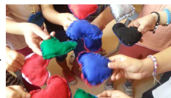
Atelier couture.

Sandrine Guerreiro , coordonnatrice des TAP, reste joignable au 06.88.42.82.81 .