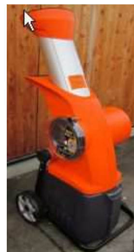
Petit broyeur de végétaux.

- samedi 22 novembre : une vente spéciale BTP (portes, fenêtres, baignoire,...) à la Ressourcerie, - samedi 29 novembre : un atelier de fabrication de tamis à compost et des jeux sur les marchés avec les ambassadeurs du tri... Plus d'infos sur www.paysvoironnais.com